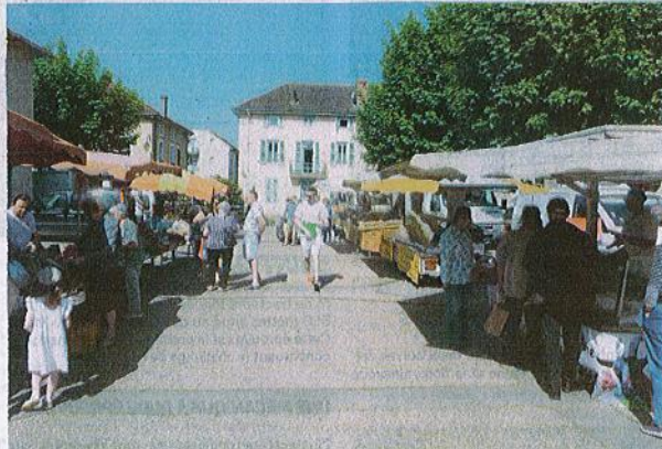
La population est invitée à donner son avis sur plusieurs thématiques : sociale, environnementale, économique, urbaine...

L'expression publique devra néanmoins coïncider avec les enjeux urbains, de mobilité, environnementaux, sociétaux, ou encore économiques, de la commune, tous déterminés par une commission communale en charge du dossier. Il s'agit de limiter l'étalement urbain afin de maintenir et préserver les zones naturelles et agricoles, tout en confortant le rôle de centralité de Montrevel sur le territoire. Il s'agit aussi de favoriser la liaison de la voie verte La Traverse avec les pôles de commerce et de services, de préserver les ressources et