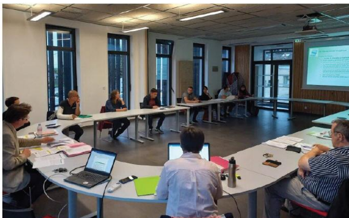
Les élus ont rencontré les commerçants et agriculteurs.

De notre correspondant Jacques Saveret - 03 déc. 2023 à 18:37 - Temps de lecture : 2 min